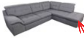
Ecksofa mit Ottomane. Element mit Rückenlehne.