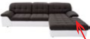
Ecksofa mit Recamiere. Element mit flacher Armlehne.

Jedes Ecksofa kann mit einem linken oder rechten Schenkel gefertigt werden.